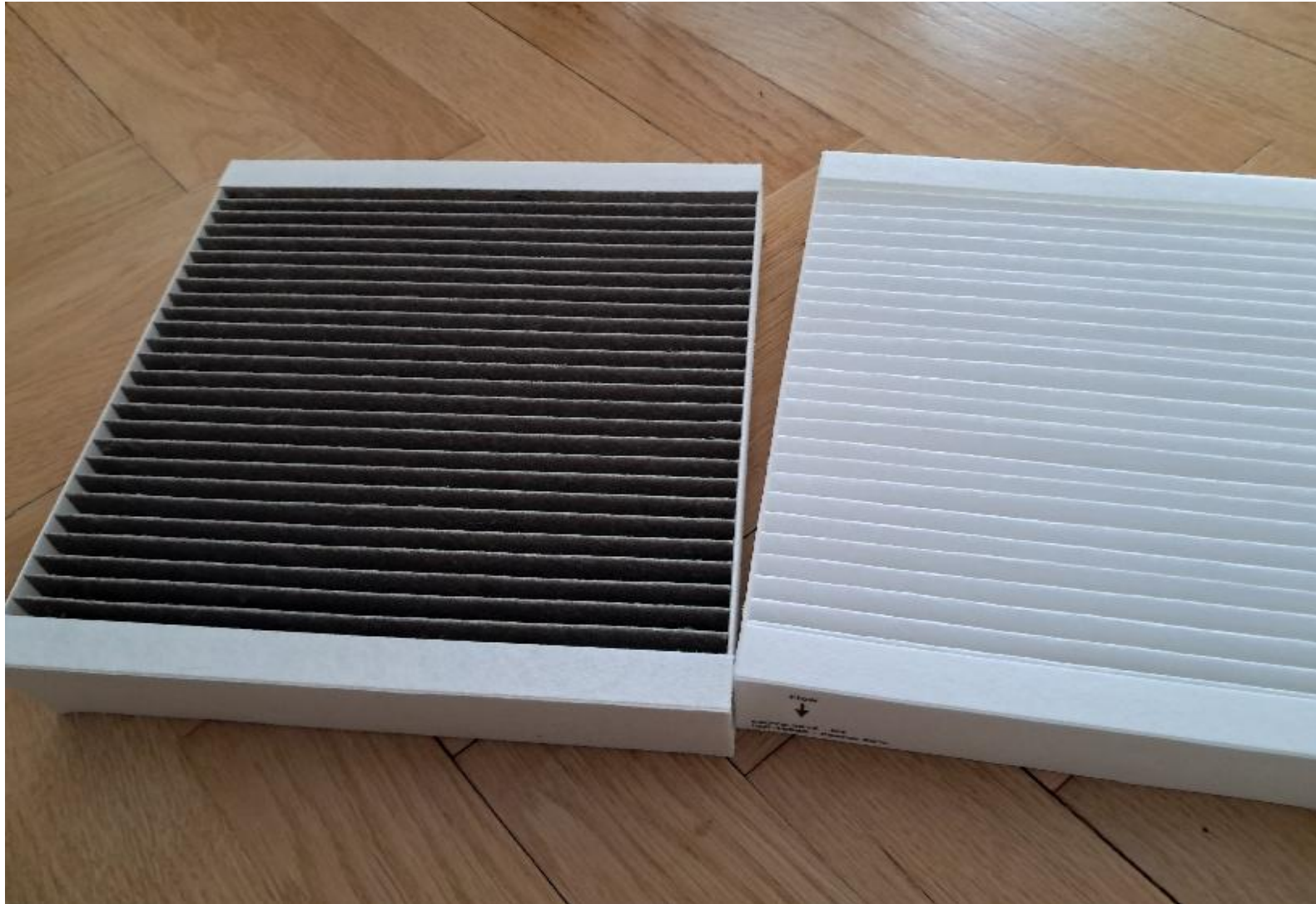
Filter fra indsugning af udeluft til Genvex anlæg. Venstre er efter 3 ugers drift i januar-februar 2026. Højre er nyt filter.